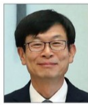
김상조 대통령 비서실 정책실장